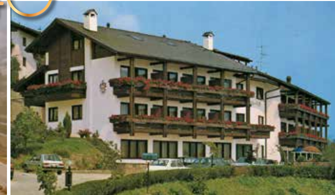
Der StephansHof im Jahre 1978 | Lo StephansHof nell'anno 1978 | The StephansHof in the year 1978