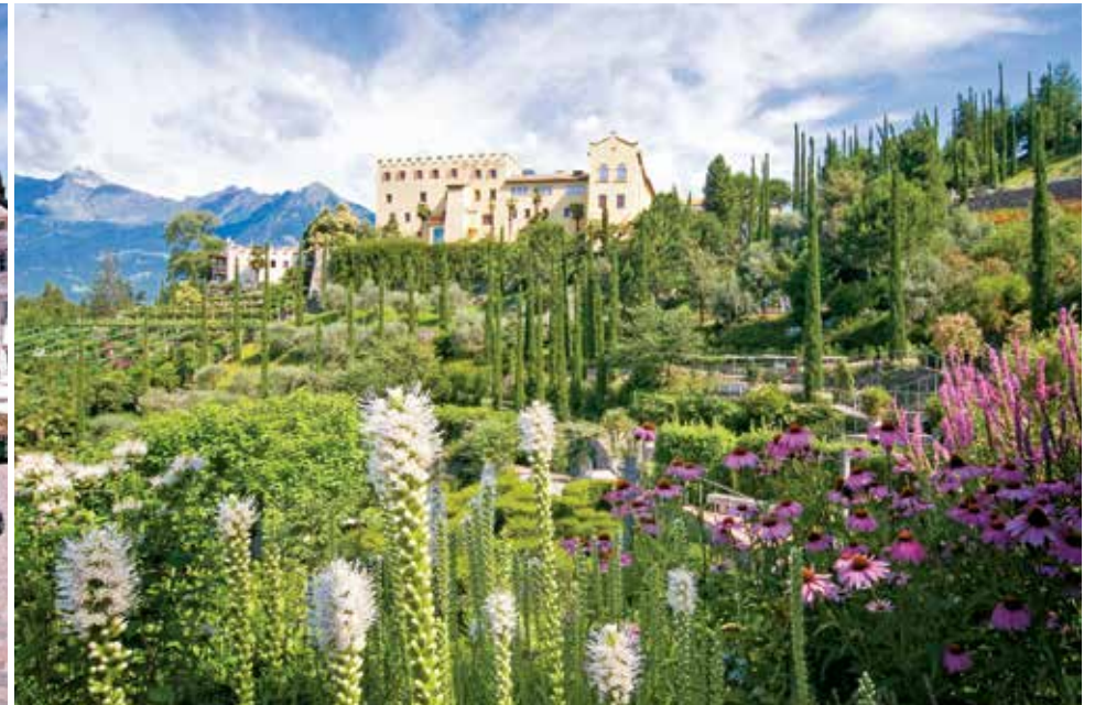
Gärten von Schloss Trauttmansdorff, Meran I Giardini di Castel Trauttmansdorff a Merano / Gardens of Trauttmansdorff Castle, Meran/Merano