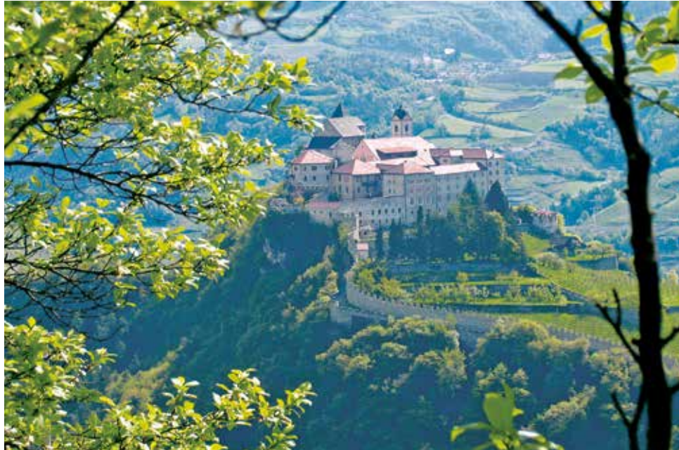
Kloster Säben oberhalb von Klausen Il monastero di Sabiona sopra Chiusa / Säben Monastery above Klausen/Chiusa