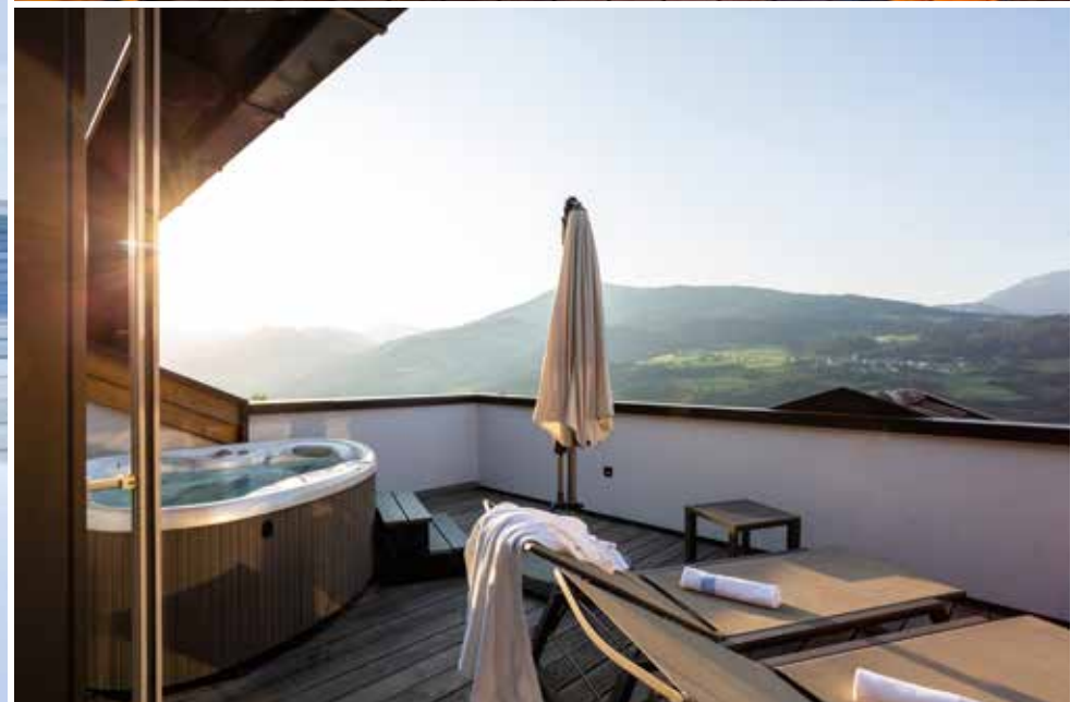
Suite Panorama & Private Panorama Spa