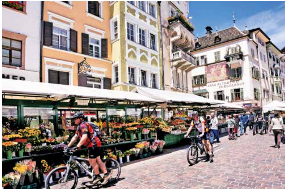
Bozen, die Landeshauptstadt Südtirols Bolzano, il capoluogo della Provincia / Bozen/Bolzano, the state capital of South Tyrol