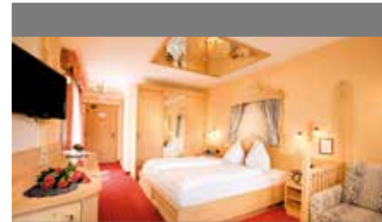
Turm Torre · Turret

Spacious room with a pleasant atmosphere. All Granpanorama rooms have wooden floors and a balcony with an indescribable panorama view of the Isarco Valley and the Dolomites - a UNESCO world heritage site.