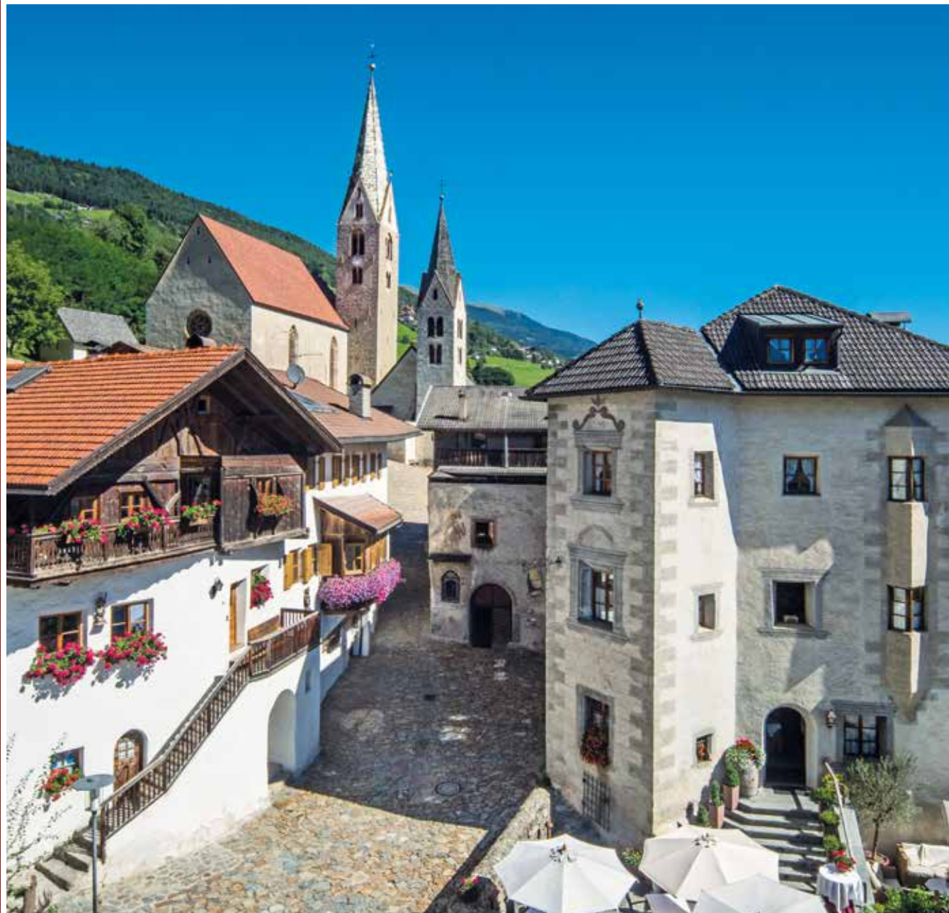
Villanders / Villandro

The municipality of Villanders lies at the geographical centre of South Tyrol. This means that the Granpanorama Hotel StephansHof is at the heart of South Tyrol and is thus the perfect point of departure for your holiday in South Tyrol.